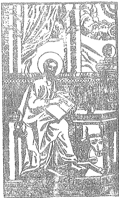
SFÂNTUL APOSTOL LUCA